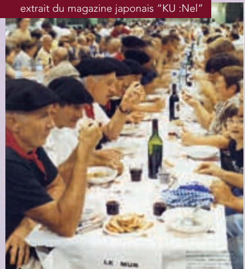
Garbure avec "Le Mur" extrait du magazine japonais "KU :Nel"