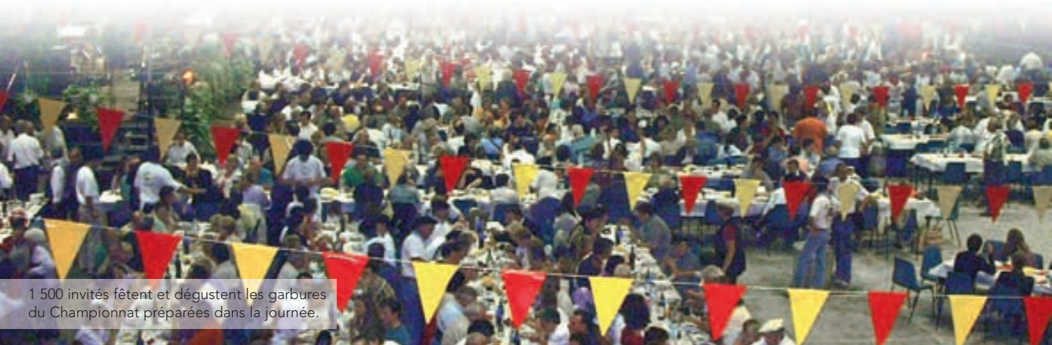
1 500 invités fêtent et dégustent les garbures du Championnat préparées dans la journée.