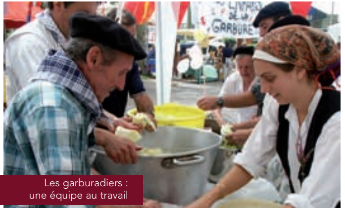
Les garburadiers : une équipe au travail