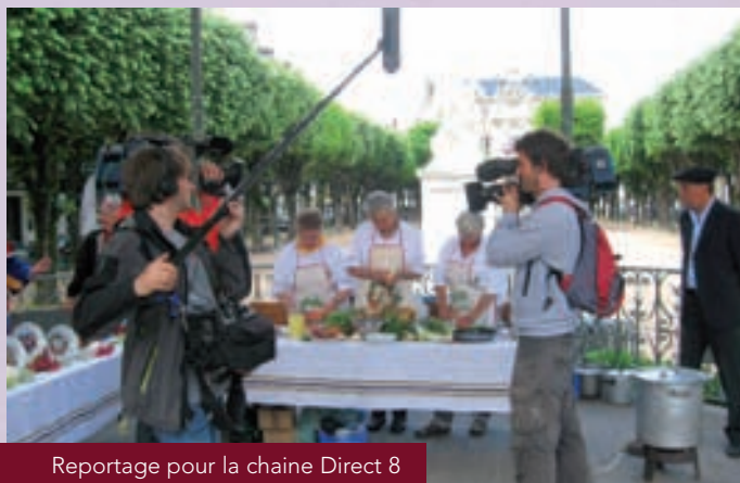
Reportage pour la chaîne Direct 8

TÉL. 05 59 88 00 65 - FAX 05 59 88 00 49