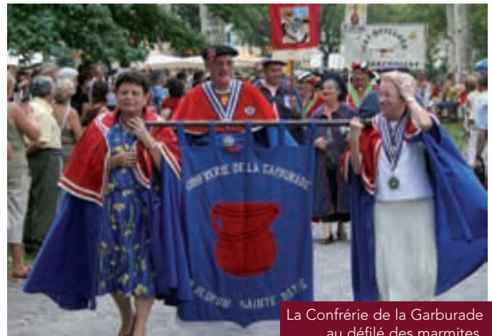
La Confrérie de la Garburade au défilé des marmites.

Email : restaurantchezmichel@wanadoo.fr - Site : www.restaurant.chez.michel.fr