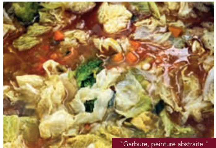
"Garbure, peinture abstraite."